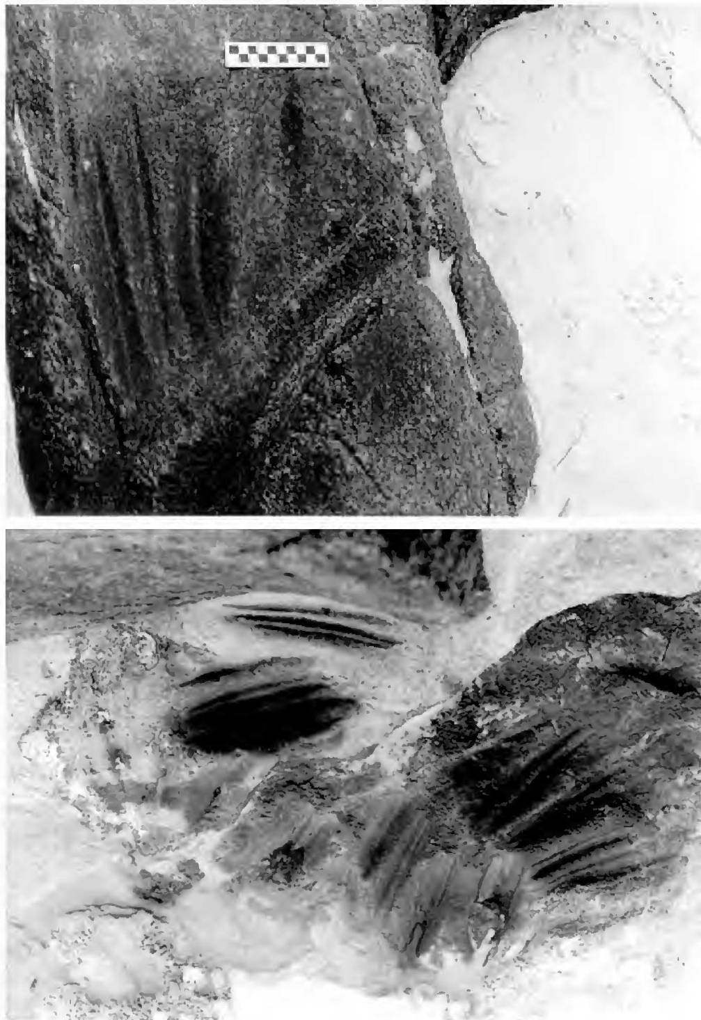
Fig.5- Sulcos encontrados na Praia de Massambaba (a) e em Lopes Mendes (b)..

no sítio Ponta da Cabeça, enquanto foi escavada 15% da área total do sítio Ilhote do Leste, os dados apresentados constituem fortes indicadores de contato entre os ocupantes da Ilha Grande e de Arraial do Cabo em determinado momento de sua ocupação pré-colonial.